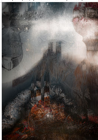
CS-04_O HRDÉM HAZMBURKU - V průběhu husitských válek stáli Zajícové na katolické straně a jejich hrad byl pro husity nepřijemnou a nepřekonatelnou překážkou. Jeho strategický význam zesilovala skutečnost, že Zajícové v té době drželi Libochovice a Budyni a jejich panství svou polohou přetínalo přirozenou spojnicí mezi kališnickými městy. Vzhledem ke své nedobytnosti, byl Hazmburk vybrán za bezpečný úkryt kostelních pokladů z Pražského hradu a roku 1440 zde byla uschována drahocenná bohoslužebná roucha. Husitům se nakonec podařilo získat Libochovice, ale Hazmburk nikdy nedobyl.