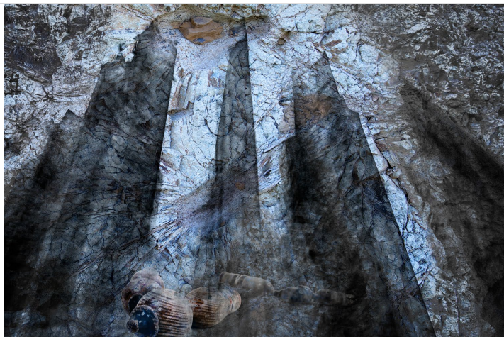
CS-06_EZOTERICKÝ, NEUKONČENÝ - Chrám Panny Marie v Panenském Týnci je nedostavěná vrcholně gotická stavba s dokončenou barokní zvonící. Podle některých psychotroniců stojí nedostavěný chrám na silné pozitivní zóně ve tvaru kříže, kde se údajně kříží dvě energetické zóny a jejich síla se tím násobí. Tato energie prý má sílu léčit depresivní stavy, úrazy hlavy a vnášet optimismus do života.