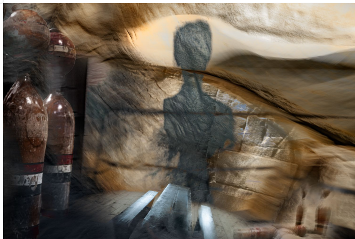
CS-08_POSLEDNÍ VEČEŘE STADICKÉHO KRÁLE - Roku 1445 se ve Stadicích objevil tajemný stařec. Byl vysoké postavy, již prošedivělý a oblečený do hrubého šatu. Svým vystupováním a výmluvností si dokázal každého získat. Usadil se pod lískovým keřem, který, jak všichni věřili, pamatoval Přemyslovu dobu. Jakub lidem vyprávěl o rovnosti, která by mezi nimi měla být. Všem, co nadšeně lidem vykládal, sám věřil a nakonec uvěřil i tomu, že se stane novým povoláním českým králem. Páni svolali radu a usnesli se, že do Stadic pošlou ozbrojené lidi, aby samozvaného selského krále zajali a odvedli do roudnického hradu.