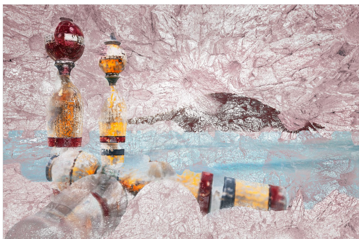
CS-01_O PRAOTCI - Tehdy stařešina (praotec Čech), jehož ostatní jako pána provázeli, mezi jinými takto promluvil k své družině: „Druhové, kteří jste nejednou snášeli se mnou těžké trudy cesty po neschůdných lesích, zastavte se a obětujte svým bůžkům, jejichž zázračnou pomocí jste konečně přišli do této vlasti, kdysi osudem vám předurčené.“

Kolekce získala ziskala Official selection v profesionálních kategoriích „Professional / SHOOT (Photo/Video)“ v soutěži LICC (LONDON INTERNATIONAL CREATIVE COMPETITION - 2021) a postoupila do finále soutěže SIENA AWARDS, Creative Photo Awards – 2021 v profesionální kategorii „Serie“