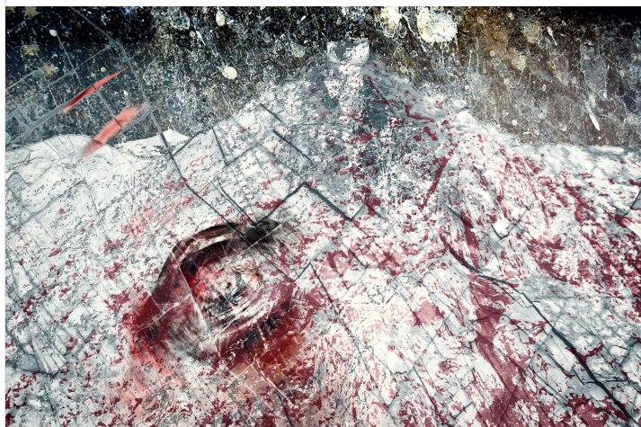
CS-03_O RŮŽI Z KAMÝKU - Otec po ní usilovně a neúspěšně pátral, a když už se vzdal veškerých nadějí a rozhodl se vrátit domů, zastavil se na zpáteční cestě v kapli templářského hradu v Malých Žemosekách. A zatímco se modlil, uslyšel hlas své dcery. Vzápětí pochopil, že se mu to nezdá, že pláč vychází z krypty v kapli. Hned pochopil, kdo dceru unesl a jak je zle. Pospíchal domů, ozbrojení sloužící i vesničany a v noci se vloupali do areálu s kryptou. Dívku už ale našli mrtvou. Růže z Kamýku uvádá.